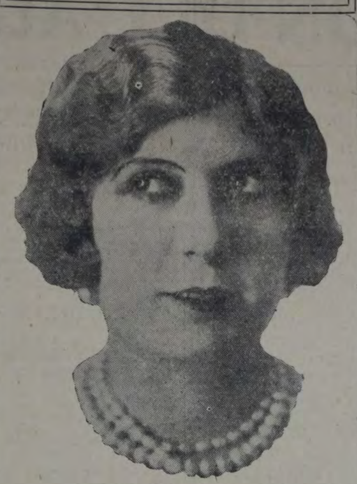
LA CONOCIDA ACTRIZ OLGA CASARES PEARSON, PRIMERA FIGURA DE LA COMPANIA SIMARI, QUE ANOCHÉ DEBUTÓ EN EL SMART.